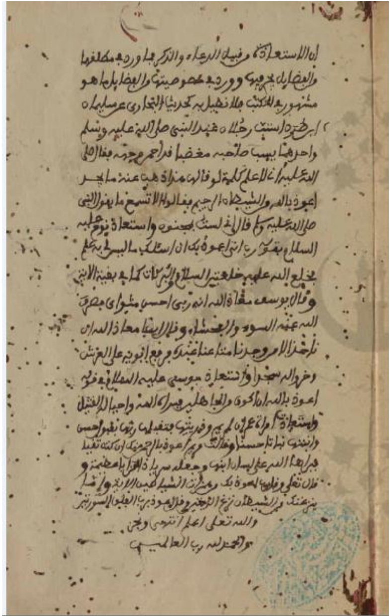
الصفحة الأخيرة .